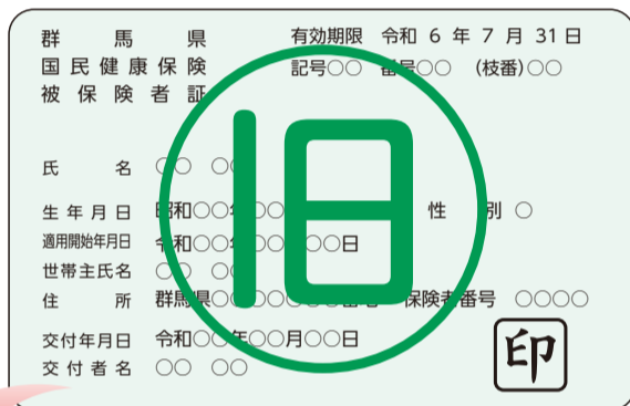
【令和5年度の被保険者証】