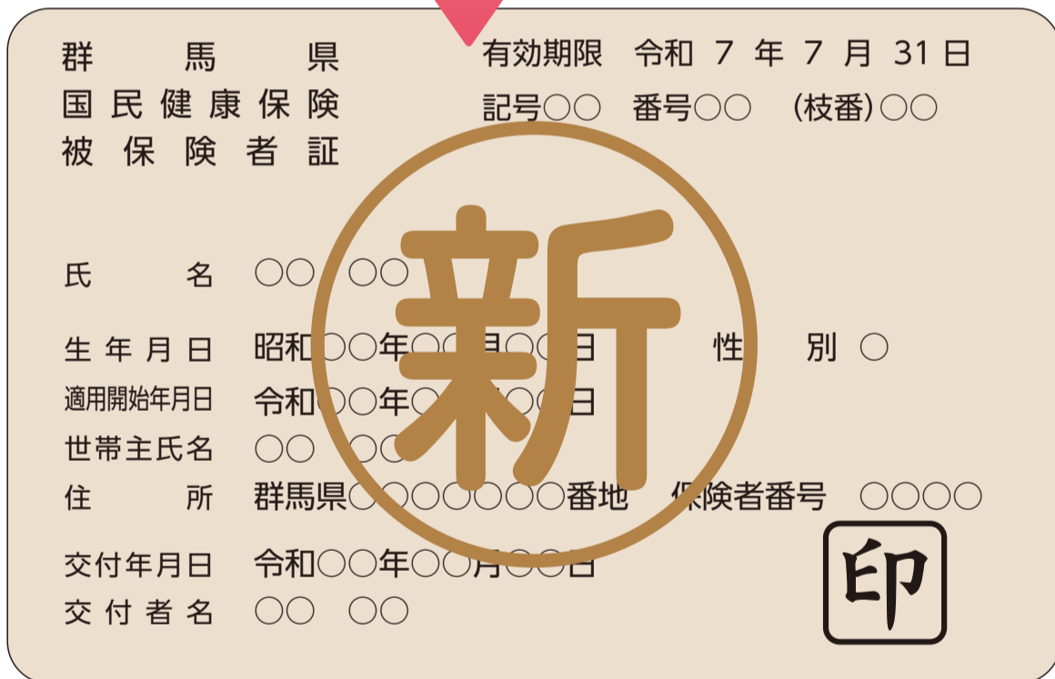
【令和6年度の被保険者証】