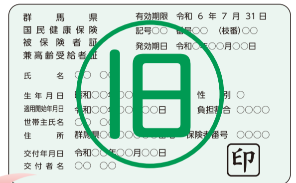
【令和5年度の一体証】