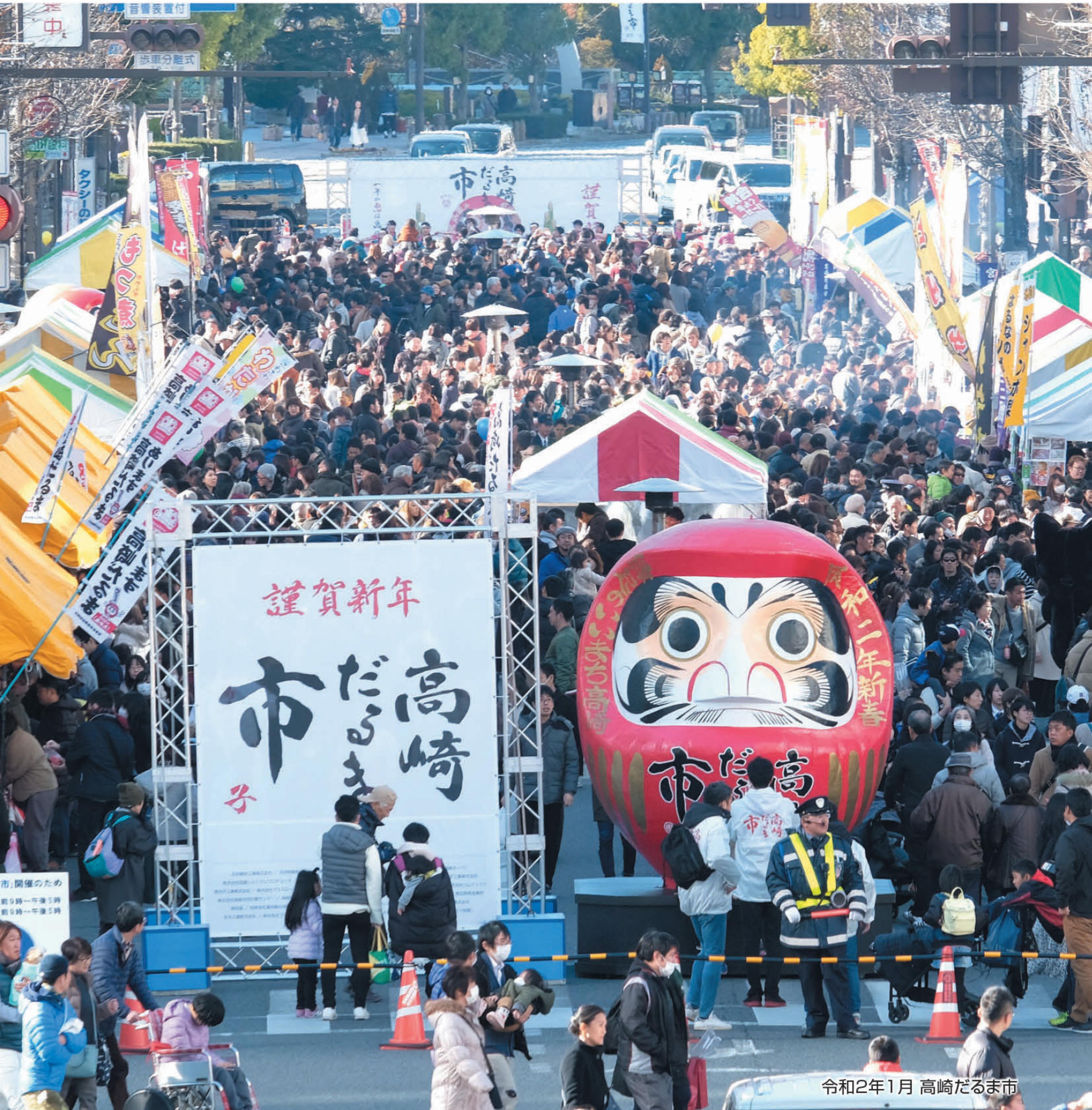
令和2年1月 高崎だるま市